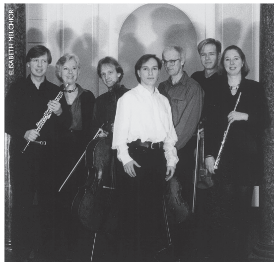
1995: Met het Gemini Ensemble